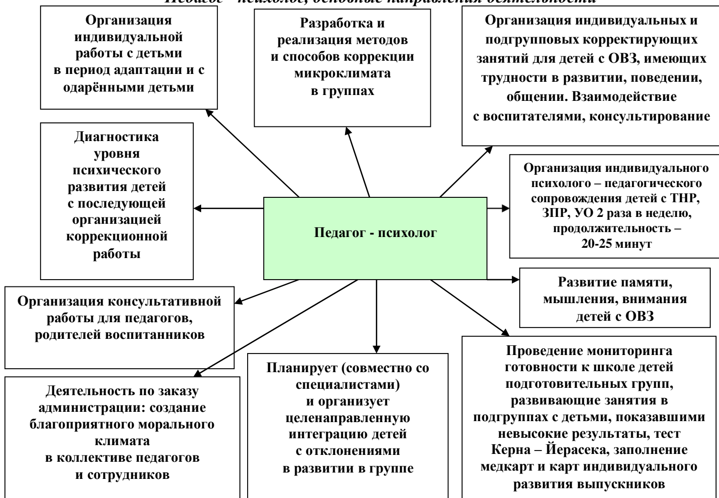
Рис. 2 «Педагог - психолог, основные направления деятельности»